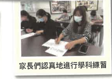
家長們認真地進行學科練習