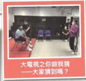
大電視之你做我猜——大家猜到嗎？