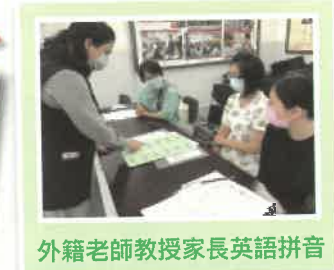
外籍老師教授家長英語拼音