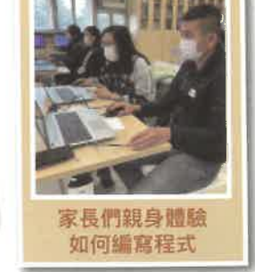
家長們親身體驗如何編寫程式