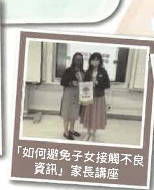
「如何避免子女接觸不良資訊」家長講座