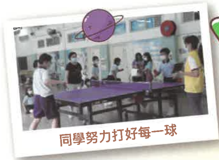
同學努力打好每一球