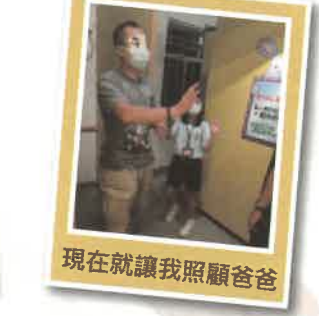
現在就讓我照顧爸爸