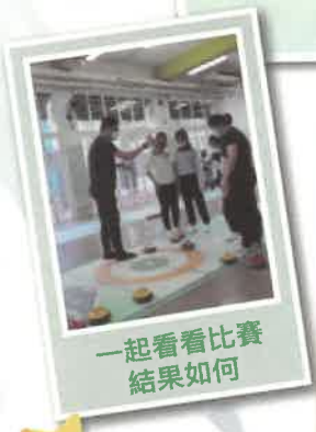
一起看看比賽結果如何