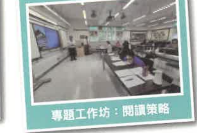
專題工作坊：閱讀策略