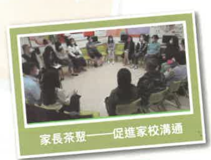
家長茶聚——促進家校溝通