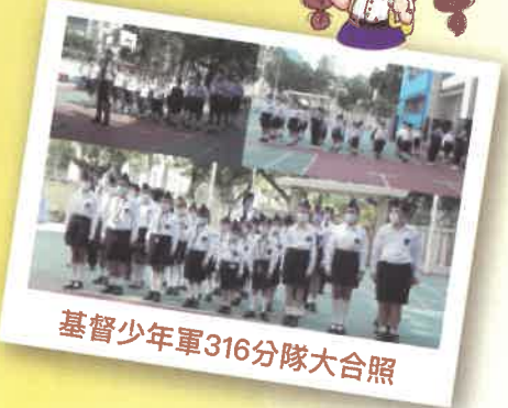
基督少年軍316分隊大合照