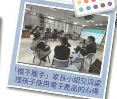
「機不離手」家長小組交流處理孩子使用電子產品的心得