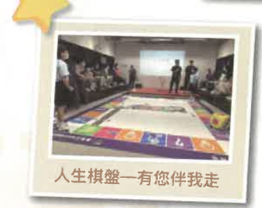
人生棋盤——有您伴我走