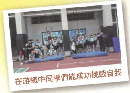
在游繩中同學們能成功挑戰自我